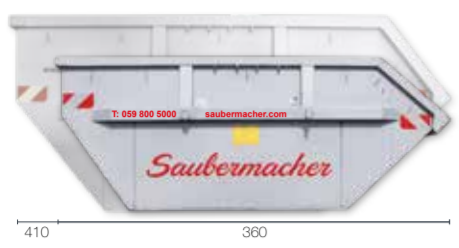
Mulde Typ 8: L 360 x B 200 x H 150 Mulde Typ 10: L 420 x B 200 x H 180