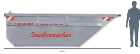
UML Typ 8: L 470 x B 200 x H 140 Umleerbehälter