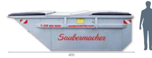
UML Typ 8 mit Deckel: L 470 x B 200 x H 140 Umleerbehälter mit Kunststoffdeckel