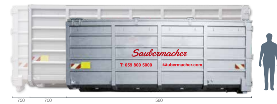
Abrollcontainer Typ 24: L 580 x B 255 x H 240, offen oder mit Windenhubdach, Optional öldichte Ausführung Abrollcontainer Typ 34: L 700 x B 255 x H 260, offen oder mit Windenhubdach, Optional öldichte Ausführung Abrollcontainer Typ 38: L 750 x B 255 x H 270, offen oder mit Windenhubdach