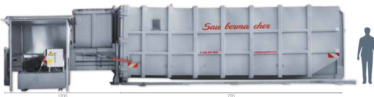
Andockbehälter für Stationäre Pressen Typ 32: L 720 x B 255 x H 260 Pressstation inkl. Andockbehälter: L 1200 x B 255 x H 260