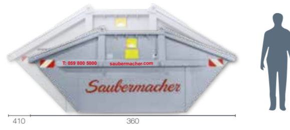
Mulde Typ 8 mit Metalldeckel: L 360 x B 200 x H 180 Mulde Typ 10 mit Metalldeckel: L 420 x B 200 x H 210