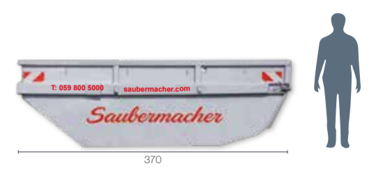
Mulde Typ 8 mit Klappe: L 370 x B 200 x H 140