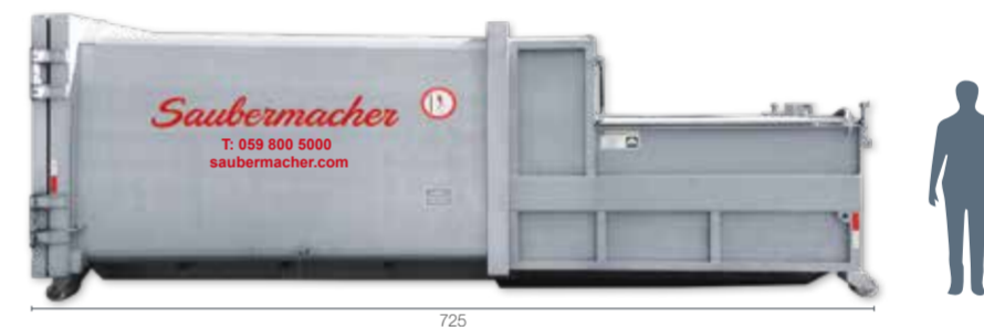
Abrollpresscontainer Typ 20: L 725 x B 255 x H 260, für Boden- oder Rampenbeschickung, Optional mit Hub-Kippvorrichtung