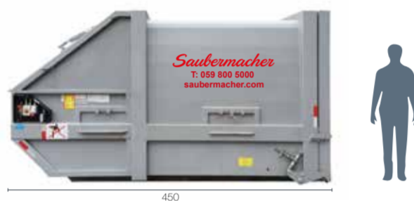
Absetzpresscontainer Typ 10: L 450 x B 200 x H 260, für Bodenbeschickung, Optional mit Hub-Kippvorrichtung