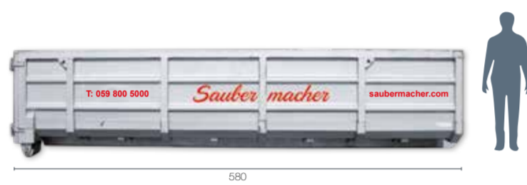
Abrollcontainer Typ 12: L 580 x B 255 x H 140, offen oder mit Windenhubdach, Optional öldichte Ausführung