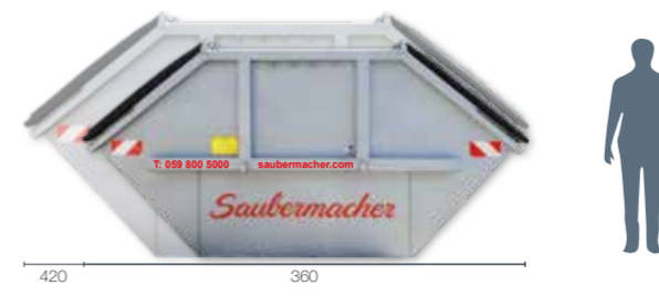
Mulde Typ 8 mit Kunststoffdeckel: L 360 x B 200 x H 180 Mulde Typ 10 mit Kunststoffdeckel: L 420 x B 200 x H 210