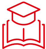
Aus- und Weiterbildung

Um die My Guides dafür so gut wie möglich zu unterstützen, bieten wir gezielte Aus- und Weiterbildungsmaßnahmen und die Möglichkeit zur Supervision an. Für den fachlichen Erfahrungsaustausch und die Behandlung von Erfolgsgeschichten finden laufend Vernetzungstreffen statt.